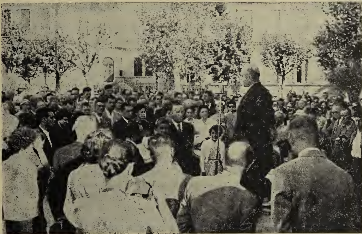
"Alaben la misericordia de Jehová, y sus maravillas para con los hijos de los hombres"